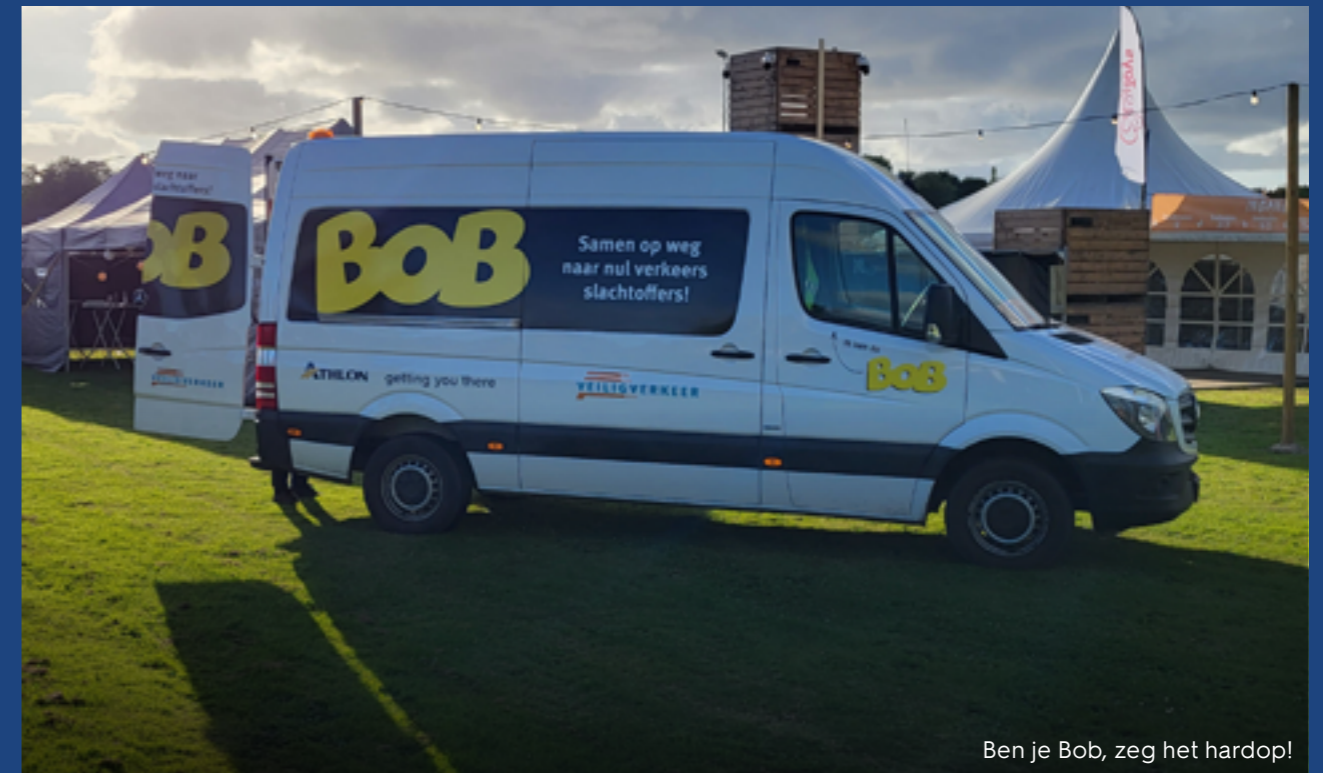
Ben je Bob, zeg het hardop!